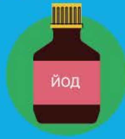
Смажьте йодом кожу около раны