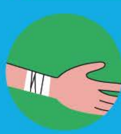
Наложите на рану марлевый или ватный тампон, не сдавливая поверхность, и закрепите