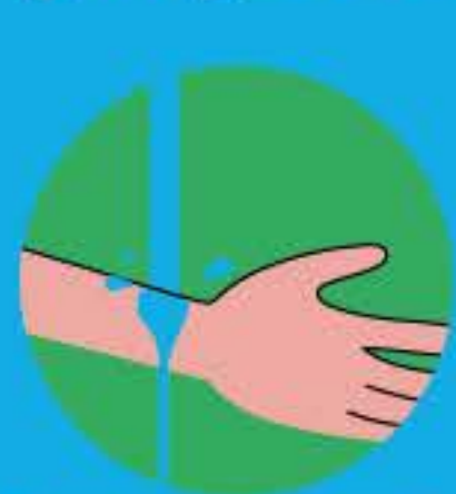
Тщательно промойте место укуса