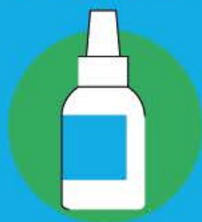
Полейте рану перекисью водорода