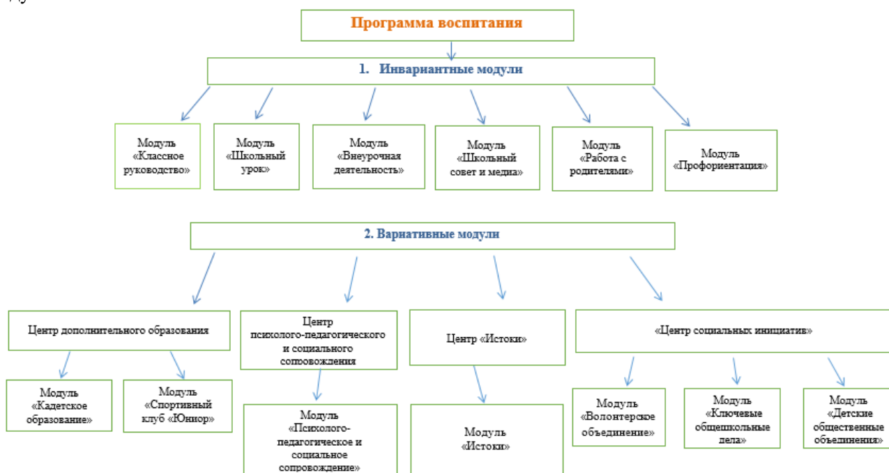
Рис. 3– Содержание Программы воспитания по модулям

Практическая реализация цели и задач воспитания осуществляется в рамках следующих направлений воспитательной работы школы. Каждое из них представлено в соответствующем модуле.