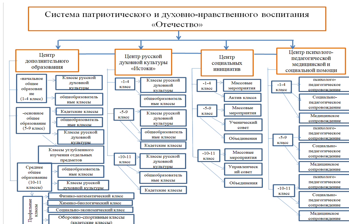
Рис. 2 Организационная структура Системы патриотического и духовно-нравственного воспитания «Отечество»